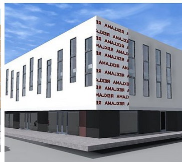
115, Gorzów Wielkopolski, dz. nr 1841 HANDLOWO-USŁUGOWE